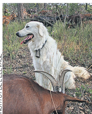
INSTITUT DE L'ÉLEVAGE